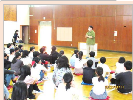
【6年生】最高学年として 通学班では上手に班旗を扱いリードする姿、学校のために力仕事をしてくれる姿、1年生の朝の準備を優しく手伝う姿・・・等々、これからの更なる活躍を期待しています。