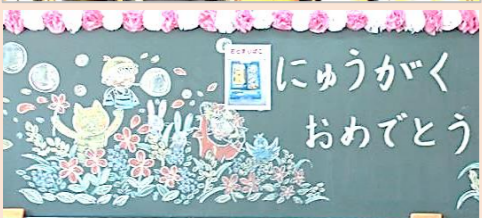
入学式 (4/8) ピカピカのランドセルを背負って、期待で胸いっぱい膨らませて登校してくる新1年生の姿は、とても輝いていました。