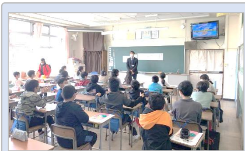
始業式 (4/8) 新たな学年、学級でのさらなる成長を楽しみにしています。