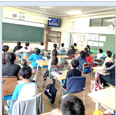
【5年生】2週間が経ちました 5年生の子ども達は新たな環境に慣れ始めています。動画配信を用いた朝会では、真剣に聞く様子が見られました。