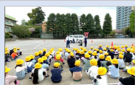
【3年生】交通安全教室 (4/18) 自転車にのるための3つの約束と、のる前の7つの点検の合言葉をしっかりと復習して、自転車にのるようにしましょう。