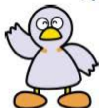
埼玉県マスコット「コバトン」